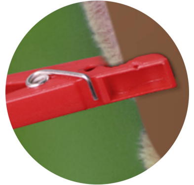
Befestigung mit Wäscheklammern